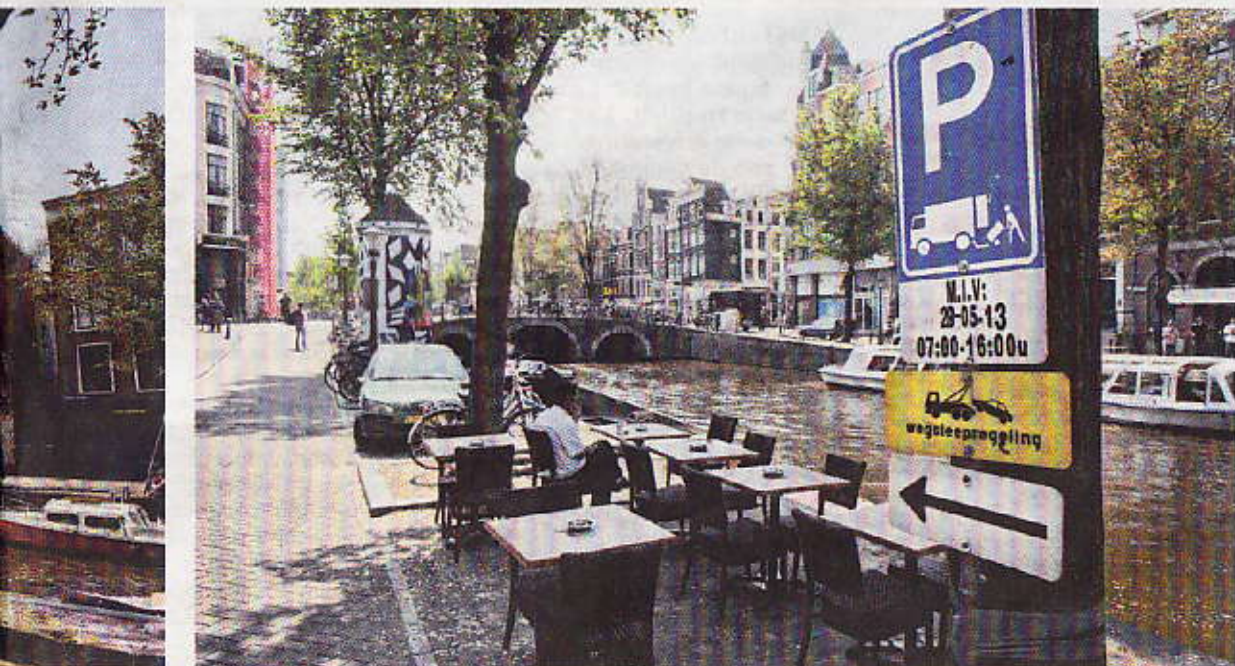
'gereserveerd' voor allerlei doeleinden, variërend van invalidenplek tot laad- en losplek (lees: terras).

sprongen." De aanvraag van een parkeerplaats kost 320 euro. Vervolgens kan men er levenslang gratis parkeren. Dat is niet terecht, vindt Illy. "Ge-