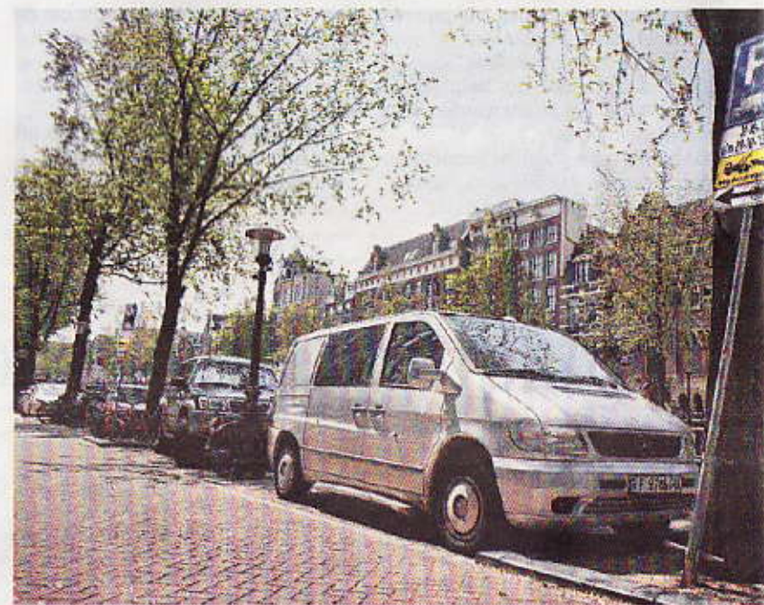
Op de Oudezijds Voorburgwal kunnen bewoners niet parkeren. De plekken zijn